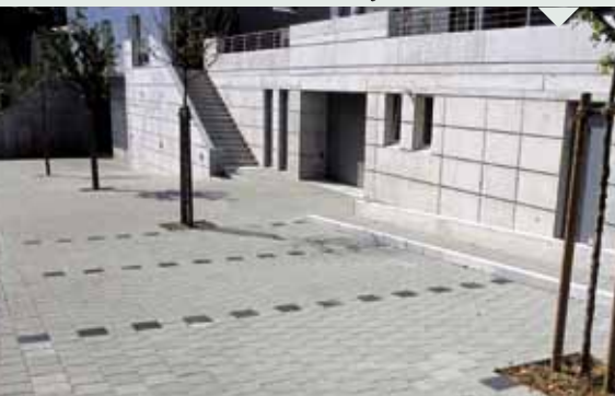
Eurofino Grau und Anthrazit